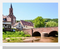
Gräfendorf mit Brücke

Wir starten pünktlich um 9:00 Uhr ab unserem Treffpunkt in Schonderfeld. Beachten sie die Straßenverkehrsordnung beim abstellen Ihres Fahrzeugs.